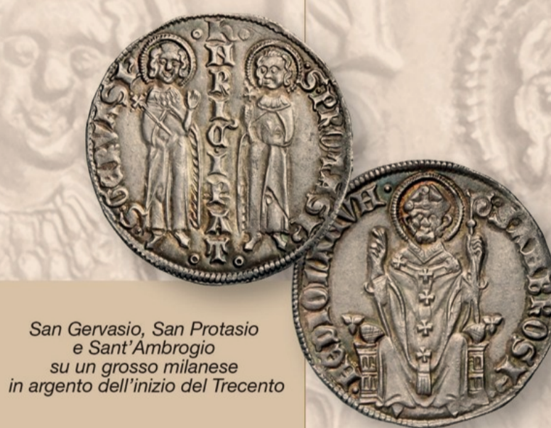
San Gervasio, San Protasio e Sant' Ambrogio su un grosso milanese in argento dell'inizio del Trecento