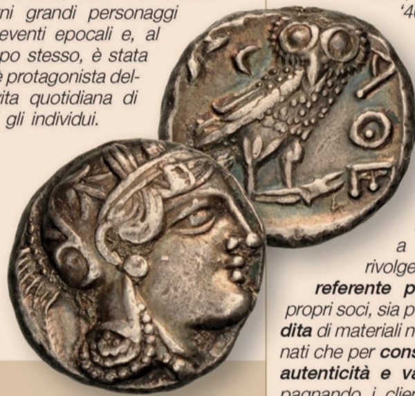
Un classico dal mondo classico, la tetradracma di Atene del V secolo avanti Cristo con Atena e la civetta

Per quanti iniziano a conoscerla e la vivono - siano collezionisti, commercianti o cultori - è innanzi tutto passione, una grande passione. La moneta, antica o moderna che sia, è infatti un "oggetto magico" che attraverso millenni di storia, economia e arte, lo spazio e il tempo. È l'essenza stessa della Storia, in un certo senso, dato che ha reso eterni grandi personaggi ed eventi epocali e, al tempo stesso, è stata ed è protagonista della vita quotidiana di tutti gli individui.